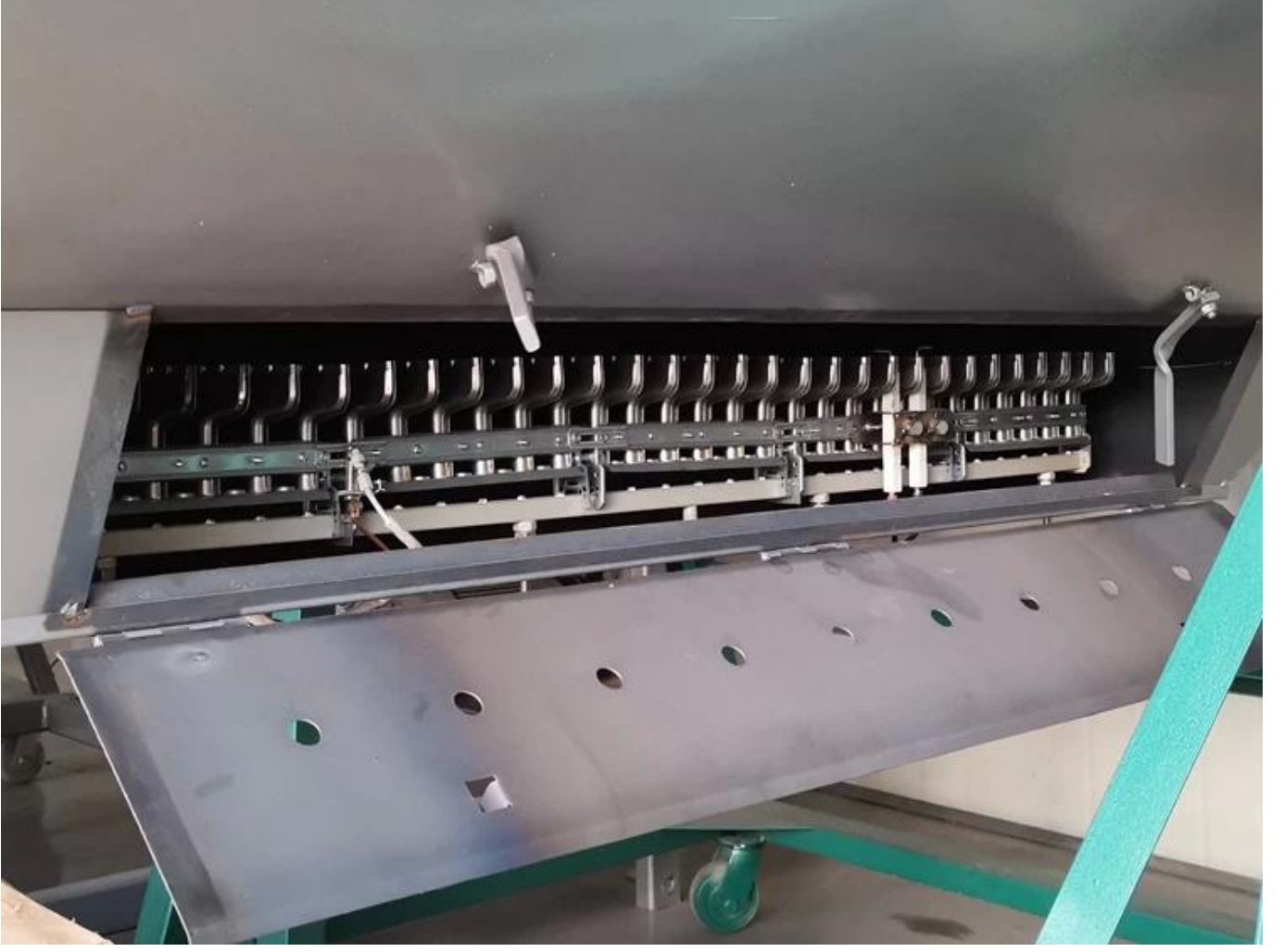
Çay sabitleme namlusunu kaplayan, %100'e kadar yanma alanı olan T şeklinde yanma ateşi takımı.