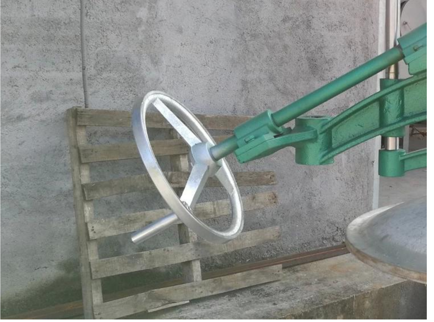
Geniřletilmiř el arkı tasarımı, namlu kapađının daha hızlı kaldırılması.