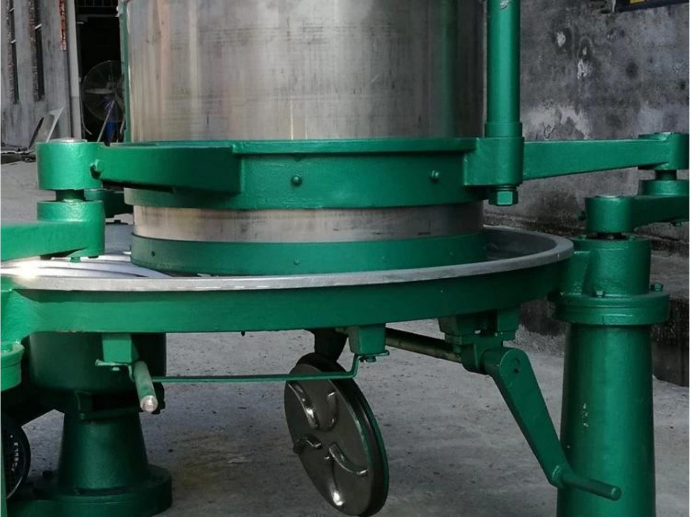
Makinenin destekleyici kısmı, güçlü ve dayanıklı olan dökme demirden yapılmıştır.